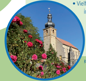
Kirche in Haina

HAINA • Kirche mit prunkvollem Hochaltar • Vielfältige Fachwerkbauten im fränkischen Stil • Gaststätte „Zur Eisenbahn“ 036948-20320