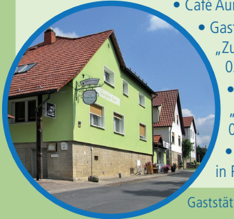
Gaststätte „Zum grünen Baum“

SCHWICKERSHAUSEN • Café Auri 036944-54422 • Gaststätte „Zum grünen Baum“ 036944-54484 • Ferienhaus „Zur Kuhtrift“ 036944-50308 • Wasserschloss in Privatbesitz