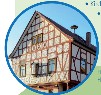
Heimatmuseum mit Hausfigur

WOLFMANNSHAUSEN • Heimatmuseum 036944-54472 • Kirche des Hl. Ägidius • Bildstöcke und Kreuzwegstationen