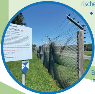
Erhaltener Grenzzaun im Freilandmuseum

BEHRUNGEN • Deutsch-deutsches Freilandmuseum mit historischen Grenzanlagen • denkmalgeschützter Ortskern • Fremdenzimmer im Kulturhaus Behrungen 036944-54851