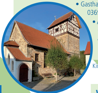
Kirche Rentwertshausen am Ortsrand

RENTWERTSHAUSEN • Kirche und Schloss • Gasthaus „Zum Hirsch“ 036944-54228 • Antica Pizzeria 036944-528522 • kleiner Zeltplatz Hauptstraße 21