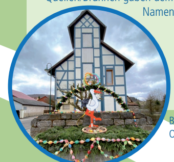
Brunnen mit Osterschmuck

NEUBRUNN • Kirche von 1231 • Quellen/Brunnen gaben dem Ort den Namen