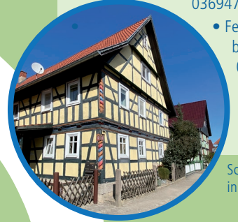
Schöne Fachwerkhäuser in Exdorf

EXDORF/OBENDORF • Kirche • Ferienhaus Familie Hanus 036947-54355 • Ferienhaus am Schwanenberg Obendorf 036947-52490 • Ferienhaus XXL Obendorf 04778-800478