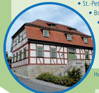
Heimatmuseum „Wilfried Büttner“

JÜCHSEN • Heimatmuseum „Wilfried Büttner“ 036944-58234 • St.-Peter und Paul Kirche • Brauerei Reizlein 036947-50902 • Gasthof „Zur Linde“ 036947-51457 • Hotel & Restaurant „Am Rosenhügel“ 036947-52890